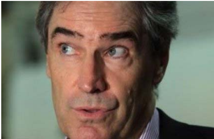
Michael Ignatieff